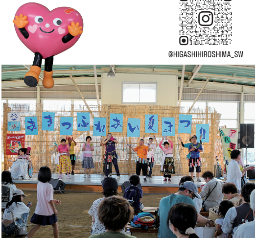
前回の様子 (自立支援センターつばさによる発表)